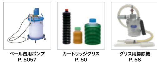
パール缶用ポンプ P. 5057 カートリッジグリス P. 50 グリス用掃除機 P. 58